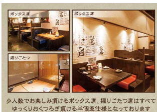
少人数でお楽しみ頂けるボックス席、掘りごたつ席はすべてゆっくりおくらぎ頂ける半個室仕様となっております。