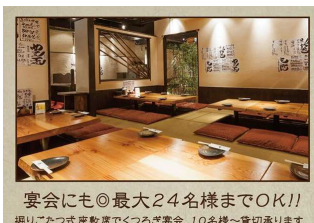
宴会にも◎最大24名様までOK!! 掘りごたつ式座敷数でくつろぎ宴会。10名様~貸切承ります。